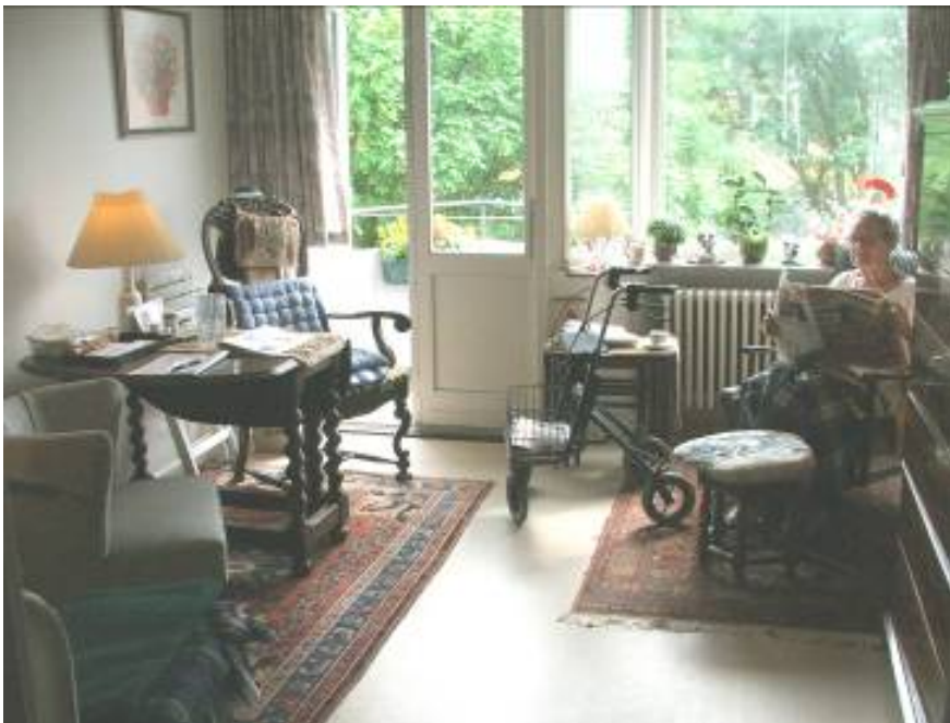
BOLIG PÅ BETANIAHJEMMET

Ved indflytningen drøftes individuel indretning som fx tæpper med afdelingens medarbejdere. Du medbringer selv møbler, billeder, gardiner og belysning (sengelampe er fast inventar). Hvis du ønsker fjernsyn og radio i boligen, skal du ligeledes selv medbringe det. Husk, ved indretning af boligen, at den også er arbejdsplads for de medarbejdere, som skal hjælpe dig med fx personlig hygiejne eller forflytning.